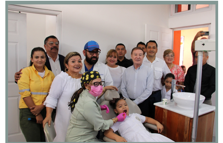
Alcaldía de Comayagua y Club de Leones, inauguran clínica odontológica en la Escuela de Niñas Rosa de Valenzuela.