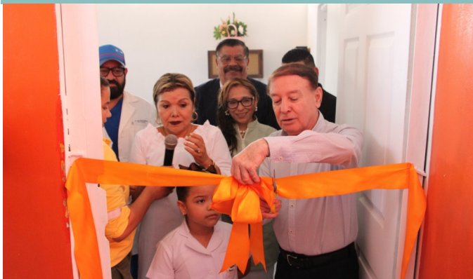
Esta clínica odontológica se beneficia más de 550 alumnas de esta escuela.

Con el objetivo que las alumnas de la Escuela de Niñas Rosa de Valenzuela, tengan acceso a salud bucal de calidad, la Alcaldía Municipal de Comayagua, que dirige el Alcalde Carlos Miranda, en coordinación con el Club de Leones, construyó una clínica odontológica en este centro educativo.