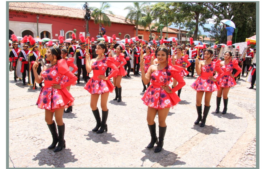
Comayagua rinde tributo a la patria con coloridos desfiles y derroche de fervor en sus 203 años de independencia