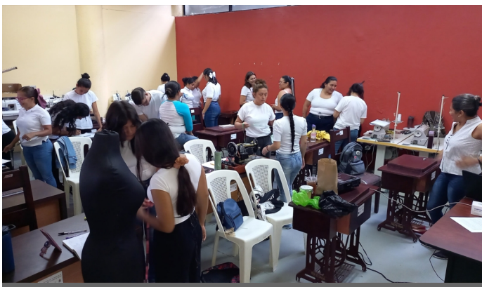
La Alcaldía de Comayagua cuenta con varias áreas de formación en la Escuela Taller.

Actualmente se encuentran disponibles los siguientes talleres: Soldadura, Albañilería, Panadero, Asistente de Cocina y Confección de Prendas; interesados llamar al teléfono 2772-3576, celular 88007792, o visitar el Centro Municipal de la Juventud.