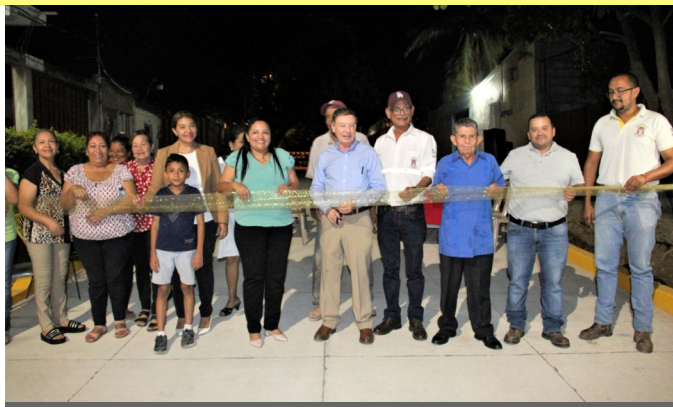
Esta obra se ejecuta con fondos de la Alcaldía más una contraparte de la comunidad.

Con el objetivo de continuar pavimentando las calles de los barrios y colonias de la ciudad, la Alcaldía de esta localidad que dirige el Alcalde Carlos Miranda, inauguró un importante proyecto de pavimentación en el barrio Cabañas de esta ciudad.