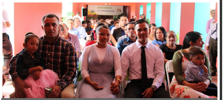
Más de 100 parejas se dieron el ¡Sí quiero!, en las bodas gratis celebradas por la Alcaldía.

En esta ocasión, más 100 parejas aprovecharon el mes de agosto, ya que según decreto 21-2019, los matrimonios y sus trámites son gratuitos, pues no tienen que pagar ningún costo en el Registro Nacional de las Personas, ni en las alcaldías municipales.