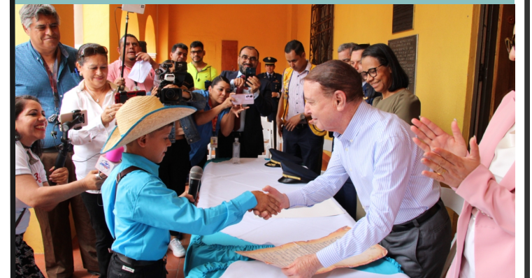
Los pliegos de Independencia llegaron a Comayagua el 28 de septiembre de 1821.