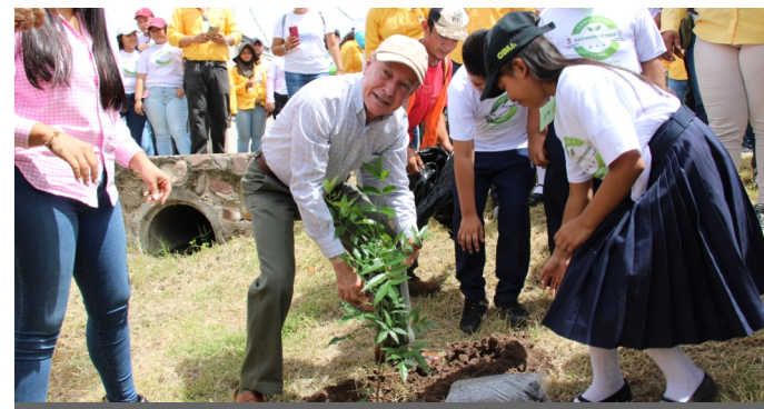
Alcaldía de Comayagua realiza esta campaña de reforestación con centros educativos.

En el lanzamiento de la campaña “Comayagua Verde, Tu acción es el futuro”, ¡Planta un árbol hoy!, se sembraron más de 100 árboles, además el Departamento Municipal Ambiental (DMA), tiene identificadas las zonas de la ciudad para continuar con esta campaña de reforestación.