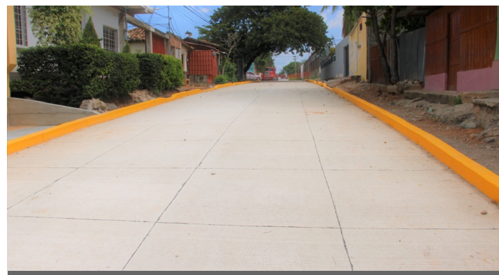
Las obras de pavimentación elevan la plusvalía, mejoran el ornato y evitan enfermedades respiratorias.

Este proyecto se ejecutó bajo la metodología de pavimentos participativos, donde la población debe organizarse en patronatos o comités para ejecutar importantes obras que contribuyen al desarrollo integral de todos los barrios y colonias de la ciudad.