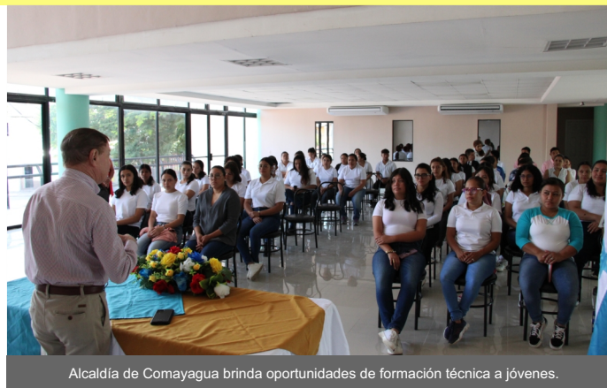
Alcaldía de Comayagua brinda oportunidades de formación técnica a jóvenes.

Con el propósito de continuar generando oportunidades a los y las jóvenes del municipio de Comayagua, la Alcaldía de esta localidad que dirige el Alcalde Carlos Miranda, inició nuevos talleres de formación técnica, totalmente gratis en la Escuela Taller de esta ciudad.