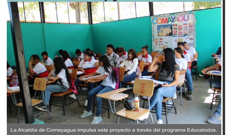
La Alcaldía de Comayagua impulsa este proyecto a través del programa Educatodos.