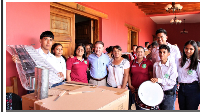
La Alcaldía de Comayagua año con año entrega instrumentos para fortalecer las bandas cívicas.

La Alcaldía de Comayagua brinda respuestas a las necesidades del sector educativo del municipio, con vínculos permanentes con los maestros y padres de familia, el cual, facilita la ejecución de proyectos educativos.