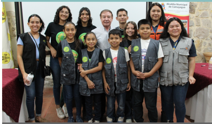
La Alcaldía de Comayagua apoya de manera permanente a la juventud.

Con el propósito de dar a conocer a la población la inversión que realiza la Alcaldía de Comayagua en la Niñez, Adolescencia y Juventud, la Corporación Municipal de esta localidad que preside el Alcalde Carlos Miranda, realizó un importante Cabildo Abierto informativo en esta ciudad.