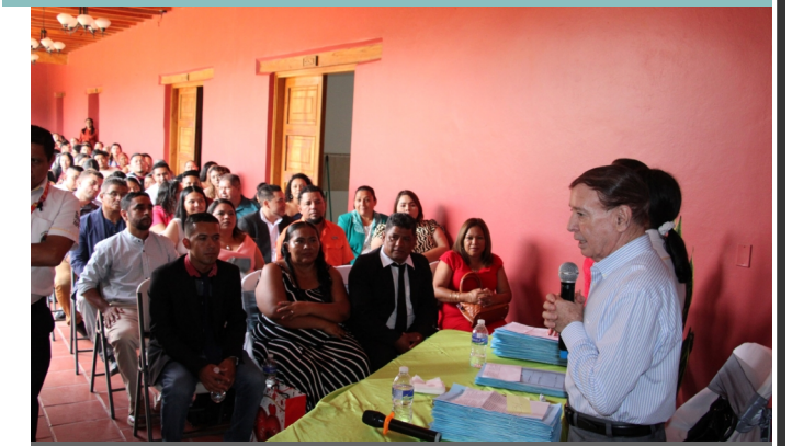
La Alcaldía año con año conmemora el mes de la familia con bodas gratis.

Más de 100 parejas se dieron el ¡Si quiero!, al contraer matrimonio civil a través de las bodas gratis, celebradas por la Alcaldía Municipal de Comayagua que dirige el Alcalde Carlos Miranda, conmemorando el mes de agosto dedicado al matrimonio y la familia.