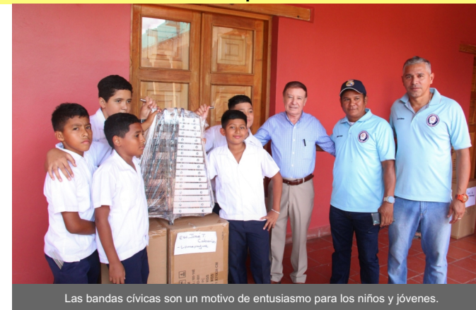
Las bandas cívicas son un motivo de entusiasmo para los niños y jóvenes.

Más de 40 centros educativos del área urbana y rural del municipio de Comayagua, beneficiados por la Alcaldía de esta localidad que dirige el Alcalde Carlos Miranda, con la entrega de instrumentos para bandas cívicas y celebrar los 203 Aniversario de Independencia Patria.