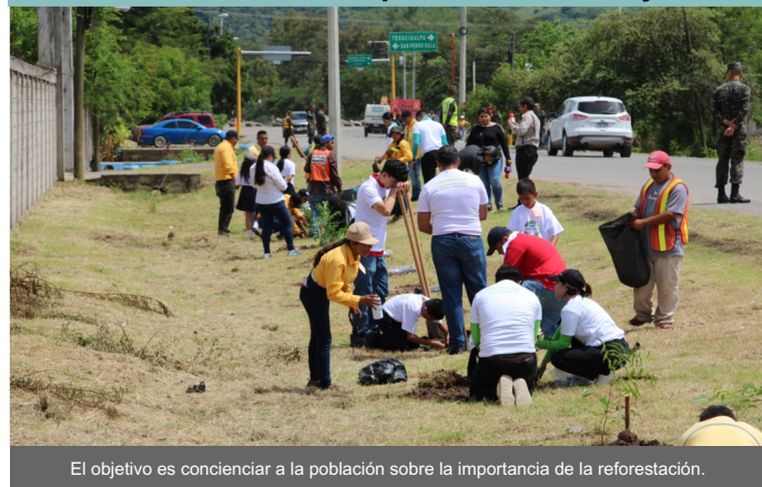
El objetivo es concienciar a la población sobre la importancia de la reforestación.