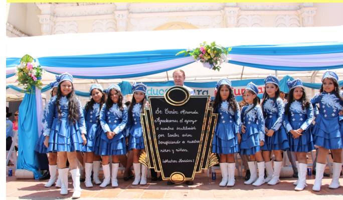
Alcalde Carlos Miranda recibe reconocimiento de parte de los centros educativos.

Con la presencia del Alcalde Municipal de Comayagua Carlos Miranda, autoridades educativas, civiles y militares, celebraron con mucho civismo y derroche de fervor los 203 aniversarios de Independencia Honduras y Centroamérica.